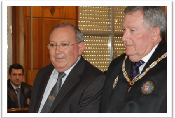
Cruces de la Orden de San Raimundo de Peñafort